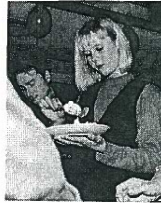
Værs'go og spis.

Over 100 gæster var med til at fejre KURT'S KVINTET®'s ti-års jubilæum i finnebyens forsamlingshus den 3. oktober 1992. Et billede kan fortælle mere end tusind ord, siges der. Så derfor bringer vi her et udpluk af festbillederne, snuppet af KURT'S KVINTET®'s faste party-fotograf, Klavs W. Larsen.