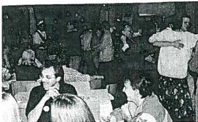
Dans v/ KURT'S KVINTET®