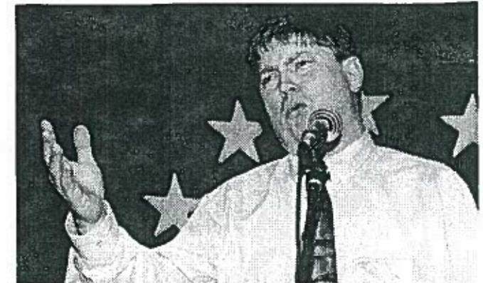
Kendt århusiansk lokal-TV-prædikant, prædiker over emnet: KURT'S KVINTET® og/eller Jesus